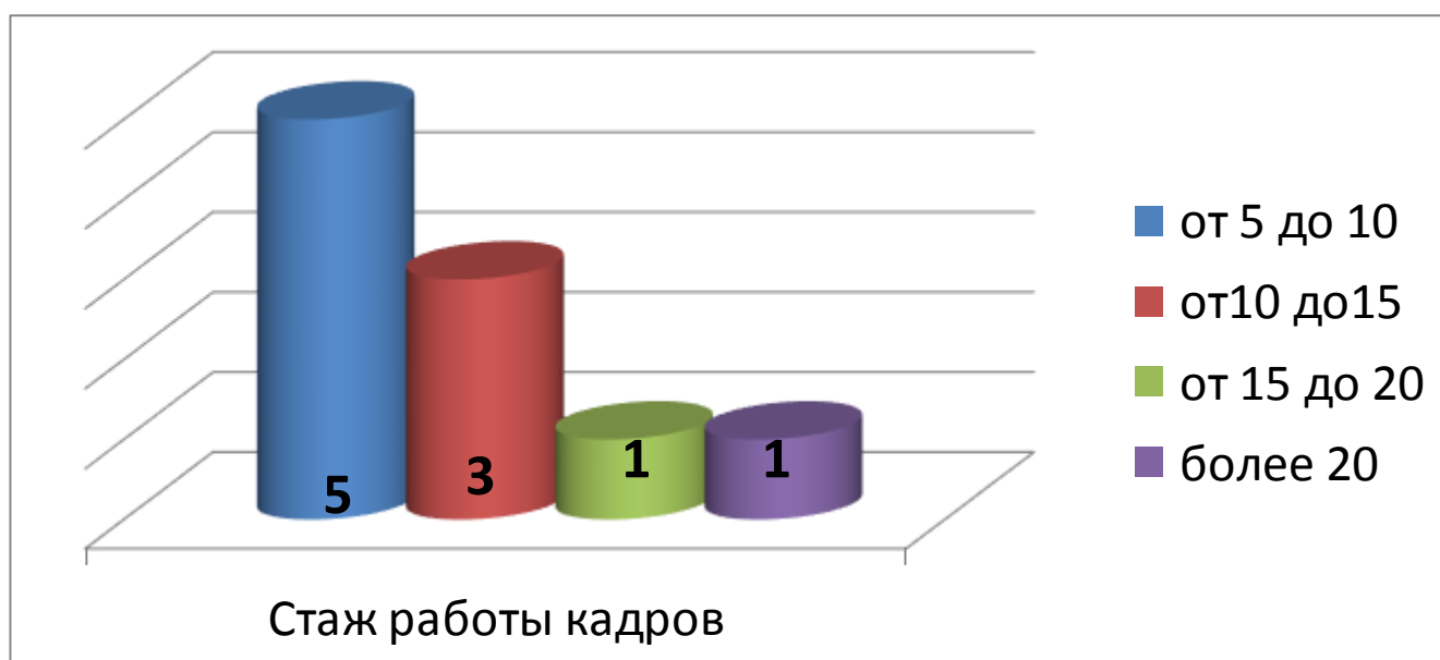
Диаграмма с характеристиками кадрового состава Учреждения.

Курсы повышения квалификации в 2019 году прошел 1 педагог Учреждения. На 29.12.2019 1 педагог проходит обучение в ВУЗе по педагогической специальности.